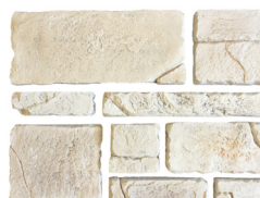
Parement L. 10 à 30 x h.5/10/15 Epaisseur 2/3/4 cm Poids moyen : 48,9 kg/m 2