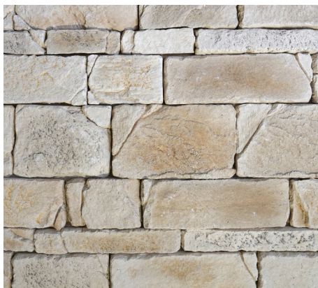
POSE EN LIGNE

Nous vous conseillons de faire une pose à blanc au sol avant de démarrer le collage, elle vous permettra de vous entraîner et de vous assurer du respect des règles de pose de ce parement selon le calepinage choisi.