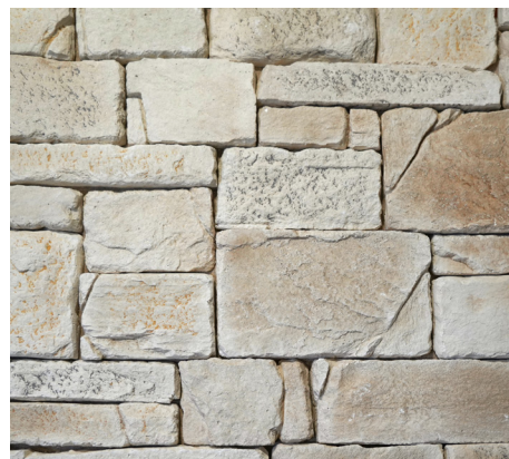
POSE EN OPUS