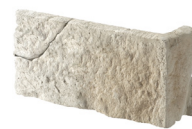
Angle L. 15/20/30 x l. 10/15/20 x h. 5/10/15 Epaisseur 2/3/4 cm