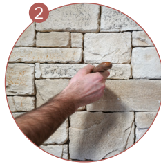
J'élimine le surplus de colle